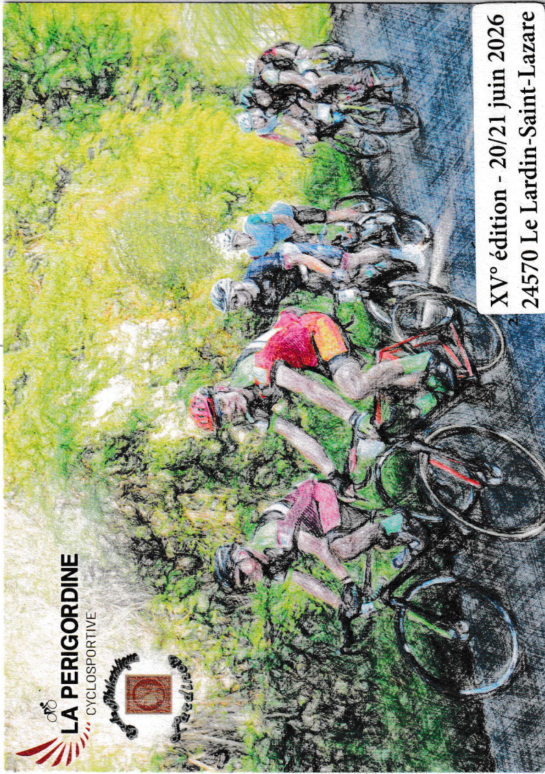
XV e édition - 20/21 juin 2026 24570 Le Lardin-Saint-Lazare