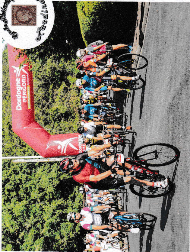
XV e édition - 20/21 juin 2026 24570 Le Lardin-Saint-Lazare